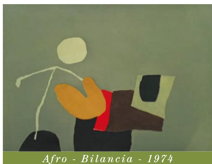
Afro - Bilancia - 1974